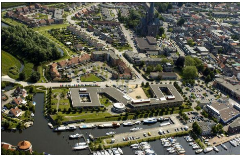
Centrum en haven Steenbergen

Website van de gemeente: www.gemeente-steenbergen.nl