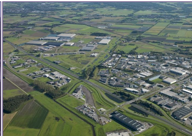
Bedrijvenpark Borchwerf II