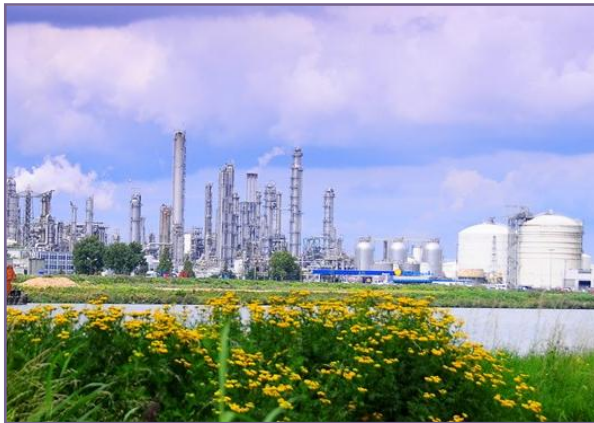
Zicht op bedrijventerrein Moerdijk

Website van de gemeente: www.moerdijk.nl