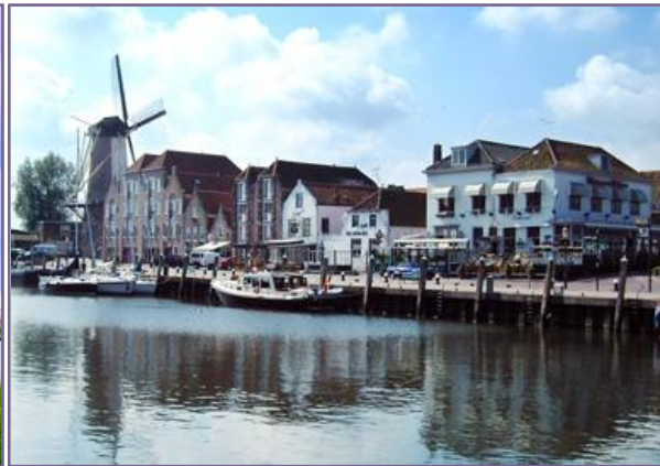
Willemstad, historische kern