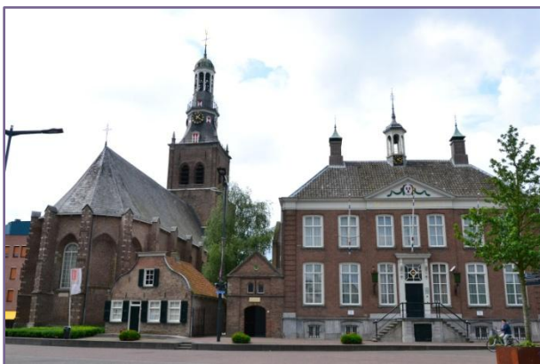
Oude Raadshuis, Etten-Leur

Website van de gemeente: www.etten-leur.nl