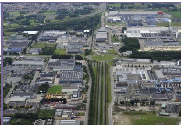
luchtfoto bedrijventerrein Vosdonk-West