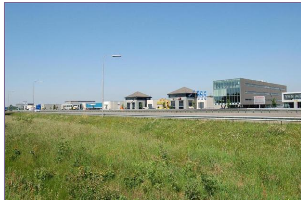
Zicht op A59 met bedrijventerrein Brieltjenspolder