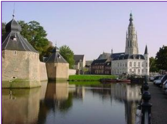
Spanjaardsgat met zicht op grote kerk