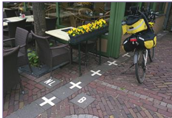
Grenzen dwars door bourgondisch Baarle-Nassau