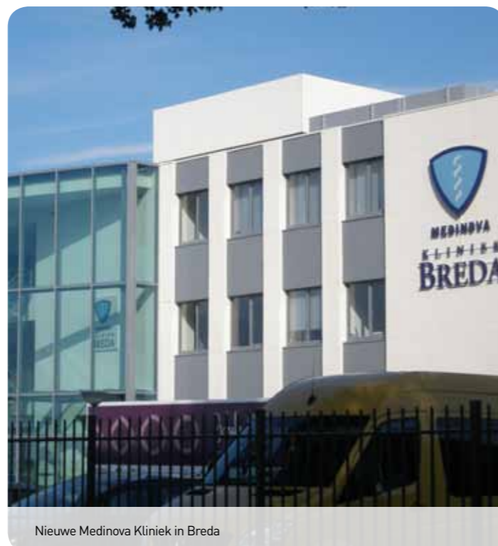
Nieuwe Medinova Kliniek in Breda