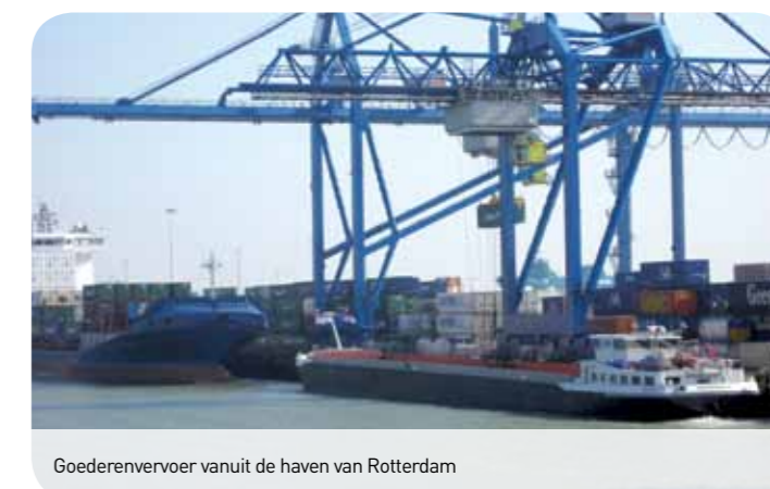
Goederenvervoer vanuit de haven van Rotterdam

* Betreffen potentiële vestigers en / of West TOP ondernemers. West TOP bestrijkt een groter gebied dan West-Brabant.