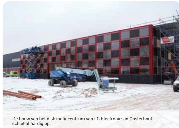
De bouw van het distributiecentrum van LG Electronics in Oosterhout schiet al aardig op.