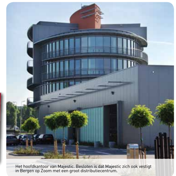
Het hoofdkantoor van Majestic. Besloten is dat Majestic zich ook vestigt in Bergen op Zoom met een groot distributiecentrum.