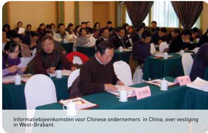
Informatiebijeenkomsten voor Chinese ondernemers in China, over vestiging in West-Brabant.

De concrete resultaten van Chinese vestigers in 2009 vielen tegen (twee bedrijven) en zijn duidelijk gerelateerd aan de wereldwijde economische crisis. Begin 2010 heeft REWIN een grote Chinese vestiger in West-Brabant welkom geheten.