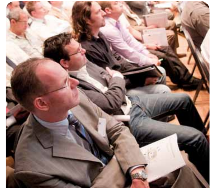
Bijeenkomst Maintenance Competence Center in Bergen op Zoom.

In oktober 2009 is het Masterplan Maintenance gepresenteerd, de roadmap die de regio gaat leiden naar een 'World Class' niveau in 2013. Het Masterplan is de opmaat naar een nationaal innovatieprogramma Maintenance. REWIN heeft in 2009 samen met andere partijen gewerkt aan het vormgeven van het Masterplan. Het Masterplan is ingediend bij het ministerie van Economische Zaken als een Nationaal Innovatieprogramma Maintenance voor 5 jaar met een totale omvang van € 50 miljoen.