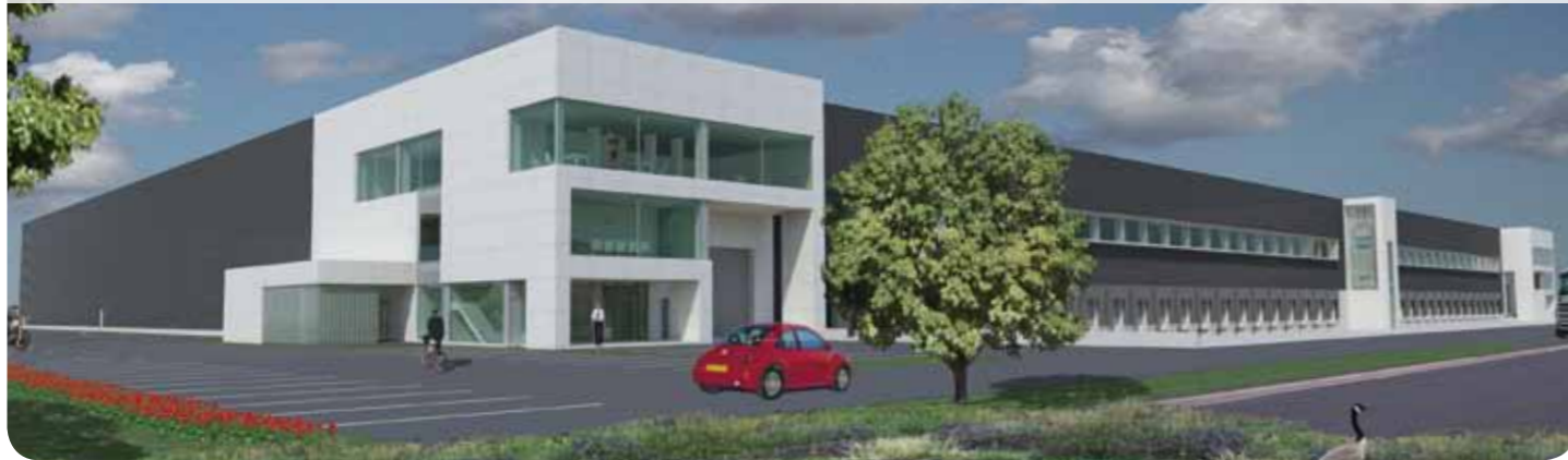
Artist impression van het grootschalige distributiecentrum van Warnaco voor Calvin Klein op Borchwerf (Halderberge/Roosendaal).